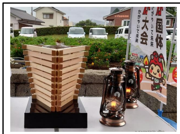
みかんを原料に作った燃料で灯された炬火