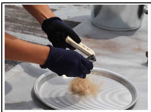
火打石と火打金を打ち付ける①