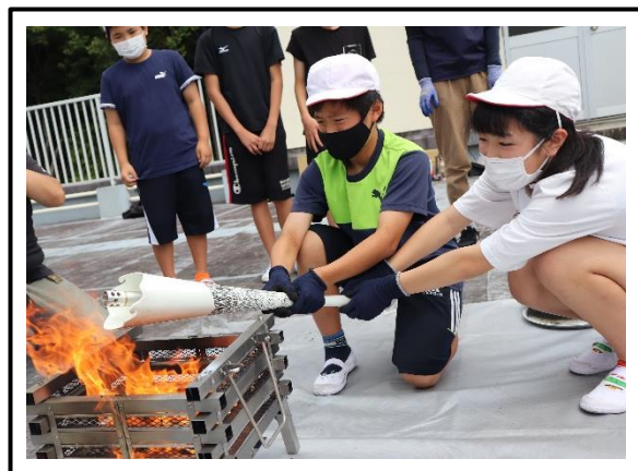
炬火トーチに点火