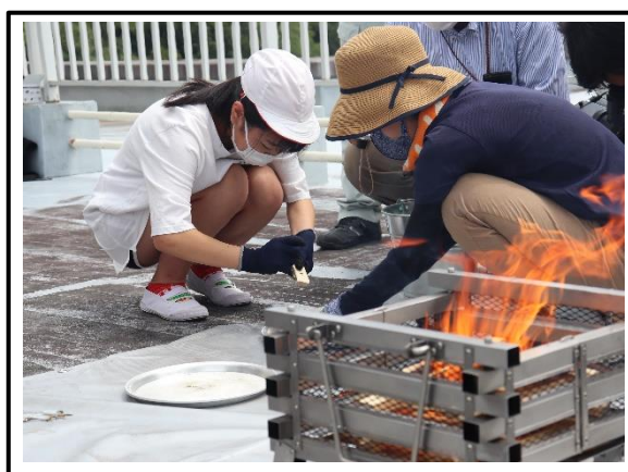
火打石と火打金を打ち付ける②