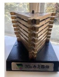
前回国体・大会の炬火受皿