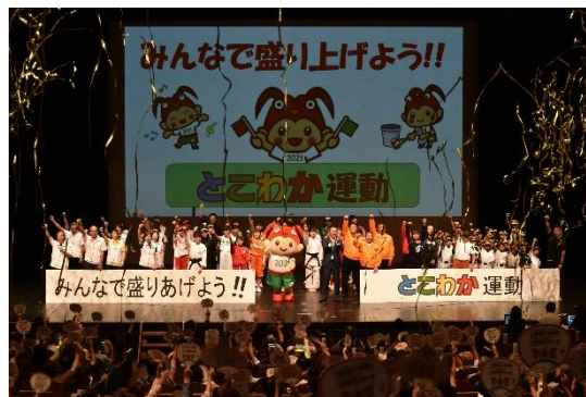
とこわか運動開始宣言

平成30年9月1日に実施した開催決定イベントにおいて、県民の方がとこわか運動の開始を宣言し、募集をスタートさせました。