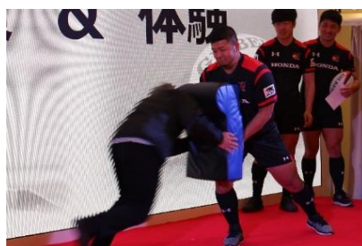
Honda HEATによるラグビー体験