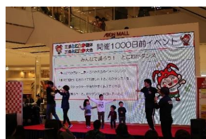
会場の人もダンスに参加