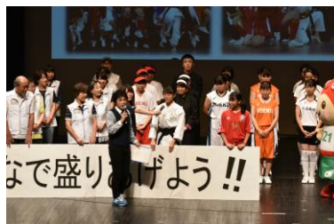
県民の皆さんによるとこわか運動開始宣言