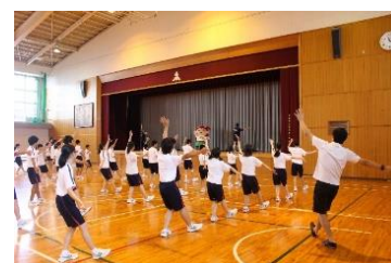
ダンスキャラバンの様子