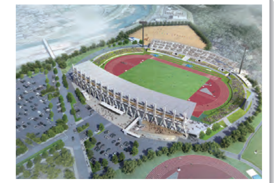
三重交通Gスポーツの杜伊勢

②競技用具の整備にあたっては、県及び会場地市町等が現有するものをできる限り利活用することとし、不足するものについては、他市町、他府県からの借用や、共同購入を検討するなど、合理的な整備を心がけていきます。