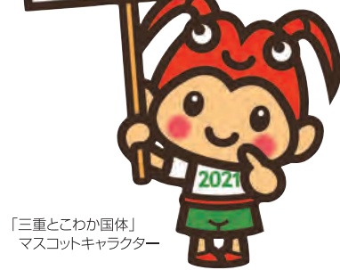
「三重とこわか国体」マスコットキャラクター