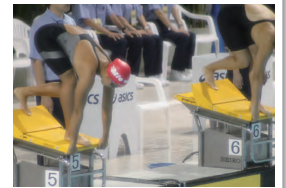
トップアスリートの参加促進

さらに、こうした取組から10年が経過し、国内外における社会情勢や新たなスポーツ界の動向等をふまえ、平成25年3月には同じく日体協が「21世紀の国体像～国体ムーブメントの推進～」を取りまとめ、少年種別の充実や各競技会の実施規模の見直しにも取り組んでいるところです。