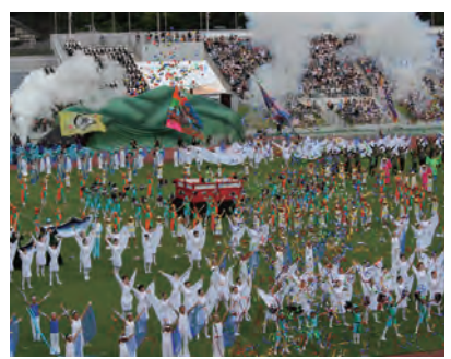
総合開会式(H27和歌山国体)

また、各競技会を「する」「みる」「支える」人びとが、いずれにおいても、その思い出を自らの達成感や充実感とともに、次世代に語り継ぎたいと思うような参加の機会づくりに努めます。