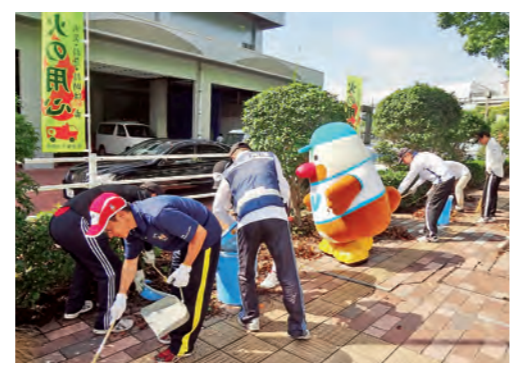
ボランティアによる環境美化運動 (H26長崎国体)

①県民の皆さんにあらゆるかたちで国体を支えていただくため、学校やNPO法人、地域コミュニティ、企業、各種団体などの協力をいただき、総合開・閉会式での大会運営ボランティア等の育成、確保に努めます。また、「みえのスポーツ応援隊」等、県民の皆さんがボランティアに参加しやすい環境づくりに努めます。