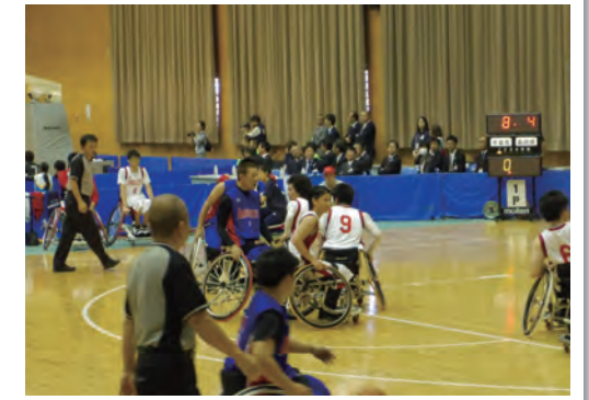
全国障害者スポーツ大会(H27和歌山大会)

国体に続き開催される全国障害者スポーツ大会を契機に、障がい者のスポーツを通じた一層の社会参加が進むとともに、県民の障がいに対する理解がより深まることをめざして、障がい者のスポーツ参加機会の充実や参加意欲の促進、障がい者スポーツ団体の育成・強化、選手の発掘・育成、練習環境の整備などに取り組んでいきます。