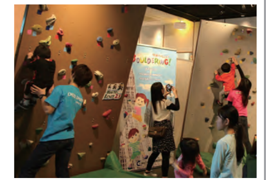
三重テラス(東京都)でのスポーツイベント