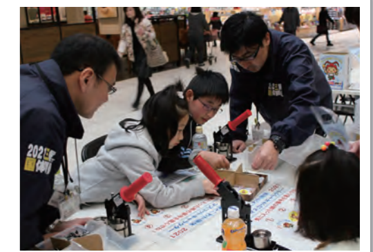
ショッピングモールでの国体啓発イベント