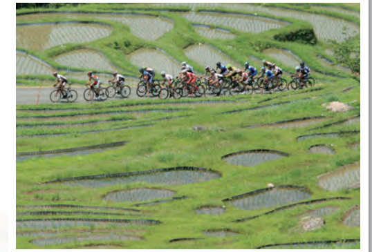
ツール・ド・熊野

国体の開催は、三重県の魅力を全国に発信する絶好の機会であることから、国体開催を通じて観光振興や県産品等のPRなど地域活性化の取組に結びつけていくとともに、会場となった施設等を活用したスポーツイベントの誘致促進など、国体の開催を契機として、スポーツを通じた地域の活性化に向けて、市町、競技団体等とともに取り組んでいきます。