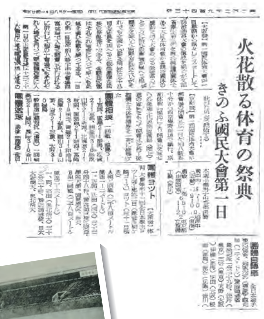
第1回国民体育大会の結果を伝える記事 (昭和21年11月2日伊勢新聞)

なお、平成13年第56回宮城大会から、国体終了後、開催県で全国障害者スポーツ大会が開催されるようになりました。