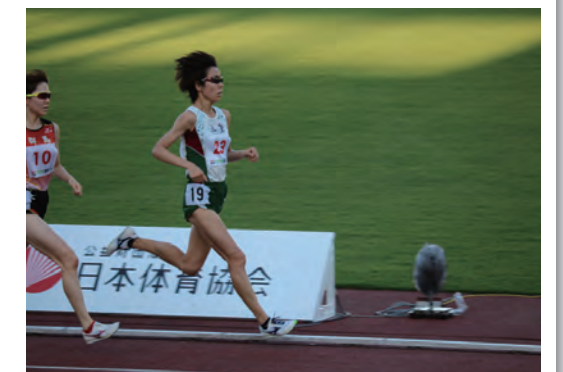
ふるさと選手の導入