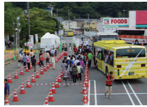
公共交通機関の利用促進(H27和歌山国体)

④公共交通機関の利用促進、再生・再利用製品の利用、ごみの減量化や分別など、リサイクル、省資源、省エネルギーに取り組み、環境への負荷が少ない国体の運営に努めます。