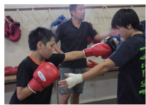
ジュニア選手の発掘

ジュニア・少年選手の発掘・育成・強化、成年選手の育成・強化・定着、指導者の確保及び資質向上や環境整備等、競技力向上の取組を推進することで、「チームみえ」として天皇杯及び皇后杯の獲得をめざします。