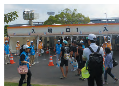
入場口ID確認・手荷物検査(H27和歌山国体)

国体の開催期間中、多数の人びとが三重県を訪れることから、大規模災害や突発事故をはじめ、大会参加者の食中毒等の事態に至るさまざまなリスクを想定し、危機管理体制を構築するなど、各種計画を策定することで安全で安心な大会運営に努めます。