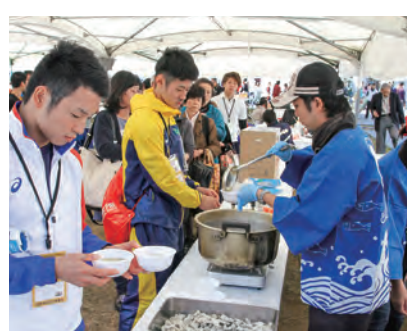
会場でのおもてなし(H26長崎国体)