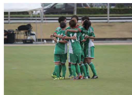
サッカー女子優勝(H27和歌山国体)

本県選手の活躍は、県民の皆さんに夢と感動を与えると同時に、一体感を醸成し、郷土への思いをともにすることができます。国体開催年での天皇杯・皇后杯の獲得をめざすとともに、国体後もジュニア・少年選手や成年選手の安定した競技力の確保に努めます。