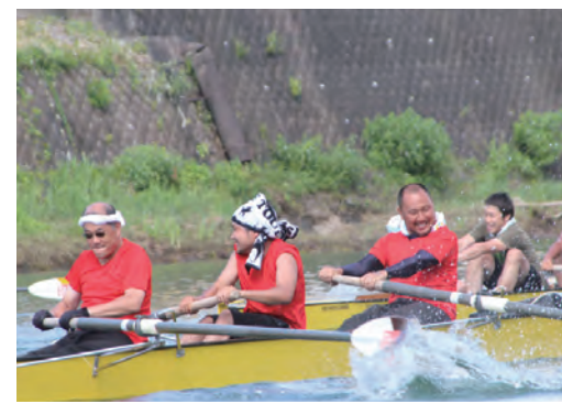
大台町水上カーニバル

国体の正式競技、特別競技、公開競技及びデモンストレーションスポーツの実施など、国体の開催を契機として、多くの県民の皆さんがスポーツに対する興味や関心を持ち、地域におけるスポーツ活動がさらに推進されるよう、県民の皆さんがスポーツを「する」「みる」「支える」活動機会の拡大に努めます。