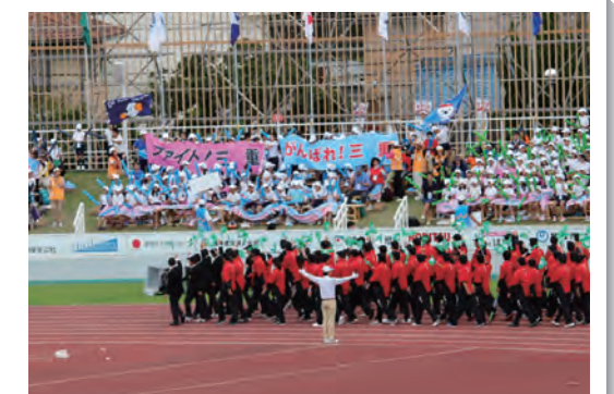
夏季・秋季大会の会期一本化